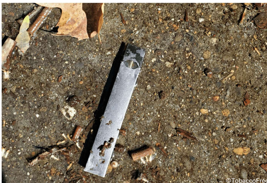
Le ENDS, come le Juul di quarta generazione, spesso non vengono smaltite correttamente

la fauna selvatica. Alcuni vaporizzatori possono persino disperdere nell'ambiente metalli pesanti e nicotina residua. 1 Inoltre, la produzione e lo smaltimento delle ENDS possono essere dannosi per l'ambiente. 56 In particolare, le sigarette elettroniche monouso, usa e getta come le Puff Bar rappresentano la più grande minaccia per l'ambiente, perché come suggerisce il nome, vengono utilizzate solo una volta e poi gettate con il loro involucro in plastica e la batteria agli ioni di litio, che è composta di litio, di cobalto e di nichel. Inoltre, oltre alle batterie e alla plastica, in genere esse contengono bobine di metallo e sostanze chimiche nocive con metalli pesanti come il piombo, oltre ad avere perdite di nicotina, che rappresentano un rischio biologico. In considerazione delle principali materie prime necessarie per realizzare le varie ENDS, la catena di produzione di questi dispositivi ha un impatto distruttivo sugli ecosistemi e sulle comunità, in quanto le materie prime necessarie vengono acquisite attraverso attività minerarie non sostenibili. 57