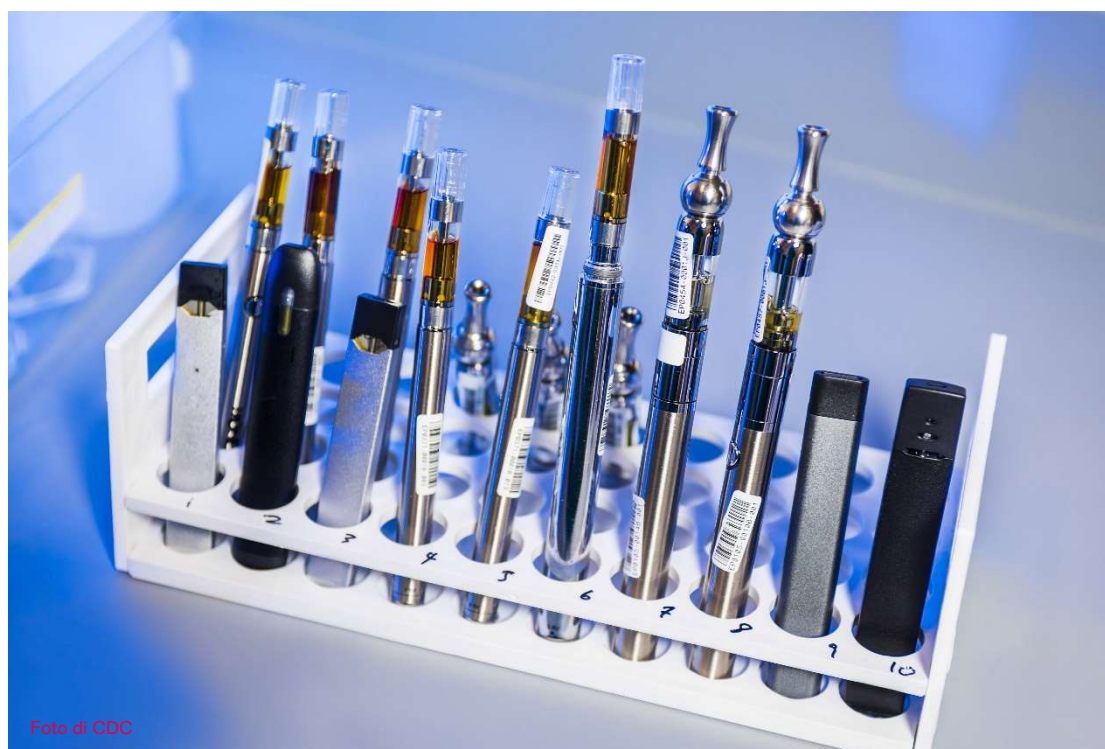
Un portaprovette con esempi di diverse sigarette elettroniche.

In Svizzera, l'uso delle ENDS è oggetto di dibattito. Mentre i professionisti della prevenzione del tabacco e delle dipendenze ritengono che la migliore scelta sia smettere di fumare completamente, riconoscono che ci sono persone che non possono o non vogliono smettere di usare la nicotina. Per queste persone, se i precedenti sforzi con la terapia sostitutiva della nicotina e con la consulenza sono inefficaci, l'uso controllato di specifiche sigarette elettroniche può aiutare la terapia di cessazione. I prodotti a base di tabacco riscaldato non sono inclusi in questo uso controllato, ma solo alcuni tipi di sigarette elettroniche ricaricabili, in cui il dosaggio di nicotina può essere ridotto nel tempo. Finora, non ci sono ricerche a sostegno dell'efficacia delle ENDS nella terapia di cessazione.