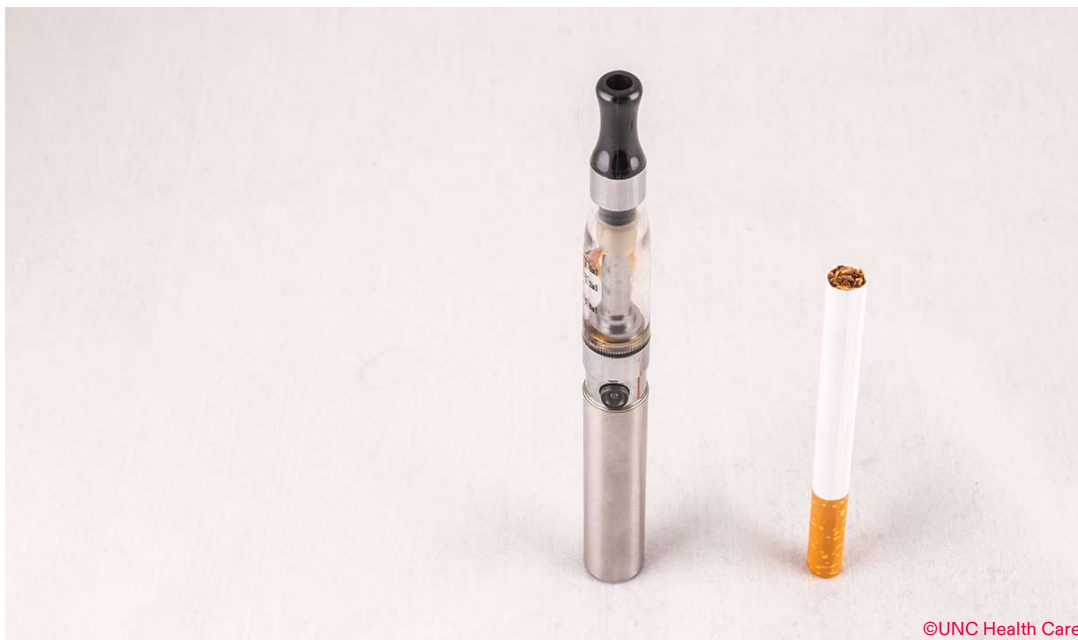
Una ENDS di seconda generazione accanto ad una sigaretta tradizionale

affermato che "Le prove sono inadeguate per dedurre che le sigarette elettroniche, in generale, aumentino la cessazione del fumo." 19