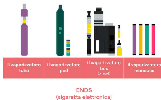
Dispositivi ENDS attualmente in commercio

Come il popolare JUUL, le pod-ENDS sono state le prime progettate per apparire e sembrare un