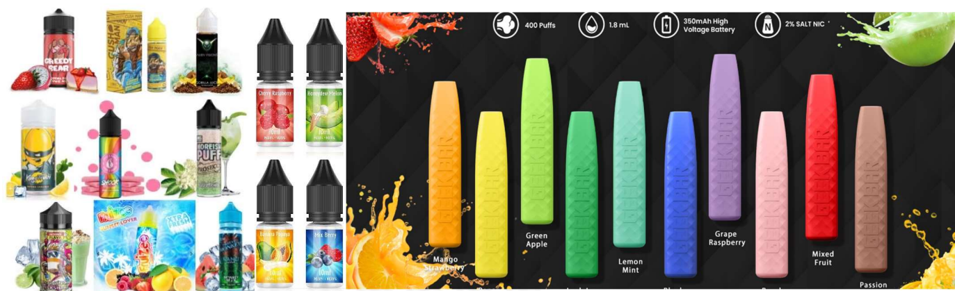
Gli aromi svolgono un ruolo chiave nell'iniziare i giovani all'uso di ENDS