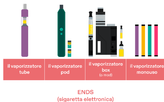
Dispositivi ENDS attualmente in commercio

Come il popolare JUUL, le pod-ENDS sono state le prime progettate per apparire e sembrare un