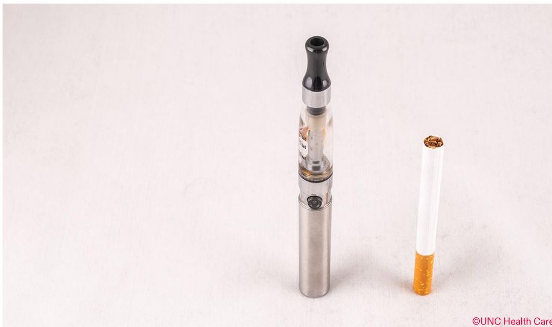
Una ENDS di seconda generazione accanto ad una sigaretta tradizionale

affermato che "Le prove sono inadeguate per dedurre che le sigarette elettroniche, in generale, aumentino la cessazione del fumo." 19