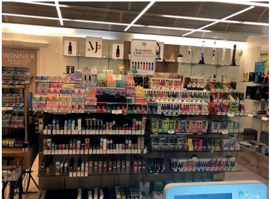
Abbildung 5: Die Regale eines ENDS-Shops in Genf (AT Schweiz).

Auch die Hersteller und Vertreiber von E-Zigaretten in der Schweiz setzen auf auffällige Verpackungen und attraktive Geschmacksrichtungen mit leuchtenden Farben und auffälligen Illustrationen, um in den Verkaufsregalen aufzufallen. Diese Marketingtaktiken sind nicht unbemerkt geblieben: Organisationen des öffentlichen Gesundheitswesens zeigen sich zunehmend besorgt über die Auswirkungen, die die ENDS-Industrie auf junge