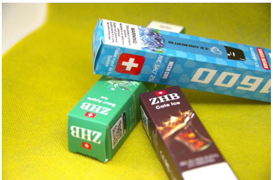
Abbildung 6: Nahaufnahme von Einweg-ENDS, beworben mit der Schweizer Flagge (AT Schweiz).

Der Bericht der Weltgesundheitsorganisation (WHO) zur globalen Tabakepidemie aus dem Jahr 2021 fordert die Auseinan-