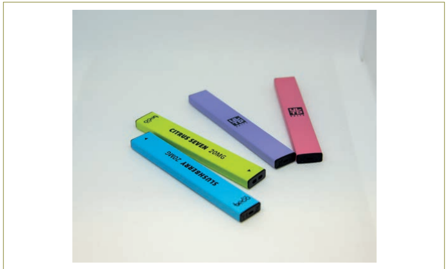
Abbildung 3: Puff Bars (AT Schweiz).

Die Attraktivität von Einweg-ENDS für Jugendliche wird durch die grosse Auswahl an Geschmacksrichtungen, Farben und Verpackungsoptionen zusätzlich erhöht. Fruchtgeschmack dominiert den Markt, wie eine Studie von Ramamurthi et al. (2023) zeigt, die 139 Geschmacksrichtungen identifizierte, von denen 82,2 % Früchte mit Menthol/Minze (Ice) kombinieren, wie zum Beispiel Lychee Ice, Lush Ice und Banana Ice. Jüngste Untersuchungen zeigen, dass die Geschmacksrichtungen «cool» und «ice» häufig synthetische Kühlmittel enthalten, die es den Konsument:innen ermöglichen, mehr zu konsumieren und dabei möglicherweise die sicherheitsbezogenen und gesundheitlichen Grenzwerte zu überschreiten (Jabba et al. 2022). Allein die beliebte Marke Elf Bar bietet über 40 verschiedene Geschmacksrichtungen an und führt ständig neue Aromen ein. Dazu gehören Apple Peach, Banana Ice, Blue RazzLemonade, Cherry Cola, Classic Cola, Energy Ice, Lemon Tart, Kiwi Passion Fruit Guava, Strawberry Energy und Watermelon Bubble-Gum. Einige Geschmacksrichtungen weisen ausgefallene Kombinationen mit einzigartigen Namen auf, wie zum Beispiel «Elf Berg», beschrieben als eine Mischung aus «saftigen Beerenaromen mit eisigem Menthol, für einen ebenso fruchtigen wie frostigen Vape» (Ruggia 2023b). Spezielle Geschmacksrichtungen werden sogar zu bestimmten Anlässen in limitierter Auflage produziert, wie Cinnamon Orange,