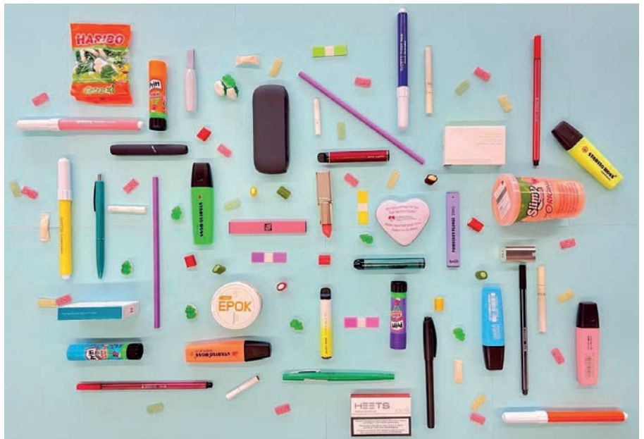
Abbildung 1: Versteckte Tabak- und Nikotinprodukte unter Schulartikeln (AT Schweiz). 1

Beispielsweise wurde festgestellt, dass Werbebotschaften, die die Unterschiede zwischen E-Zigaretten und Zigaretten betonen – wie «gesünder», «kostengünstiger» und «nützlich für die Raucher: