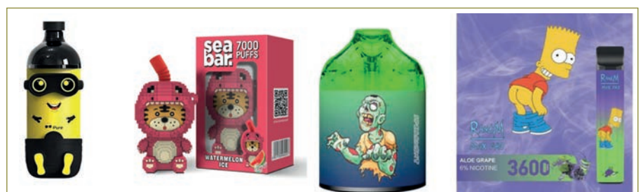
Abbildung 2: Auswahl an Einweg-ENDS für Jugendliche (AT Schweiz).

Ein häufig genannter Grund für die wachsende Beliebtheit von Puff Bars und anderen Einweg-ENDS ist die Interaktion von Jugendlichen auf beliebten Social-Media-Plattformen wie YouTube, Instagram und TikTok, wo allein in den USA mehr als ein Drittel der 49 Millionen aktiven TikTok-Nutzer:innen unter 14 Jahre alt sind (Smith et al. 2023). Trotz der Marketingbeschränkungen auf Plattformen wie TikTok und Instagram in Bezug auf Inhalte, die Minderjährige beim Konsum oder Besitz von Alkohol, Drogen oder Tabak zeigen, sind Hinweise auf den Konsum von Puff Bars durch Jugendliche in nutzergenerierten Inhalten und zielgerichteter Werbung nach wie vor weitverbreitet (Rosenthal et al. 2022b). Eine