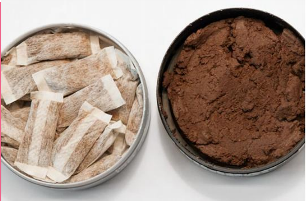
Illustration extraite du Swiss Dental Journal SSO : Sachets de snus et tabac en vrac (Sieber et al., 2017).

Associazione svizzera per la prevenzione del tabagismo