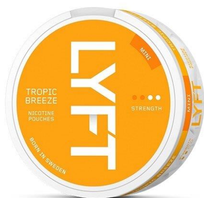
Ci-dessus : Il est établi que des parfums tels que « Tropic Breeze » séduisent les jeunes.

Des snus sans tabac ont également fait leur apparition sur le marché, comme par exemple les marques Snus Kickup, ou Lyft, également vendues sous le nom d'Epok, qui appartiennent toutes à British American Tobacco. Ces sachets de nicotine constituent une nouvelle forme non réglementée de produit oral à base de nicotine, dont l'apparence et l'utilisation sont similaires à celles du snus traditionnel. Comme le snus traditionnel contenant du tabac, ils sont proposés dans une gamme de parfums qui séduisent les jeunes, comme « Tropic breeze » (brise tropicale) ou « Royal purple » (violet royal). De plus, des offres spéciales sont également proposées, permettant aux consommateurs d'acheter des boîtes à 3.30 CHF l'unité.