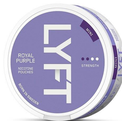
Ci-dessus : Parfum « Royal purple » de Lyft