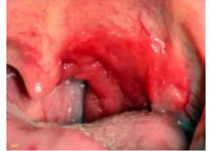
Ci-dessus: Une forme de cancer du pharynx

Dans la mesure où le snus n'est ni fumé ni inhalé, certains risques pour la santé, comme le cancer du poumon, sont moins élevés que dans le cas du tabagisme classique. Cependant, d'autres risques semblent plus importants. Les données mondiales sur la consommation de tabac non fumé suggèrent un lien étroit avec divers cancers de la bouche et du pharynx, les cardiopathies ischémiques, les accidents vasculaires cérébraux et les complications périnatales. 12 Comme pour les produits du tabac combustibles, la consommation de tabac non fumé est également associée