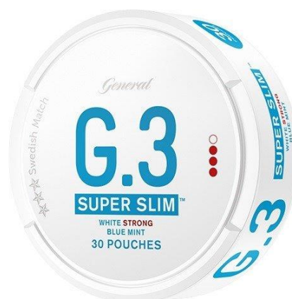
Ci-dessus : Snus plus cher, contenant 30 sachets, à 10.12 CHF la boîte.

Des snus sans tabac ont également fait leur apparition sur le marché, comme par exemple les marques Snus Kickup, ou Lyft, également vendues sous le nom d'Epok, qui appartiennent toutes à British American Tobacco. Ces sachets de nicotine constituent une nouvelle forme non réglementée de produit oral à base de nicotine, dont l'apparence et l'utilisation sont similaires à celles du snus traditionnel. Comme le snus traditionnel contenant du tabac, ils sont proposés dans une gamme de parfums qui séduisent les jeunes, comme « Tropic breeze » (brise tropicale) ou « Royal purple » (violet royal). De plus, des offres spéciales sont également proposées, permettant aux consommateurs d'acheter des boîtes à 3.30 CHF l'unité.