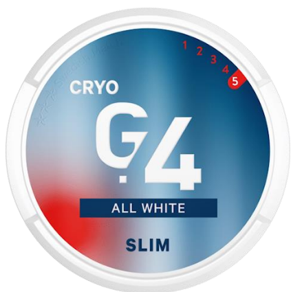
Ci-dessus : Snus G.4 accessible à partir de 3.40 CHF la boîte.

le prix du snus T45 à 3.70 CHF la boîte. Sur un autre site Internet, on peut trouver des prix aussi bas que 3.40 CHF par boîte de snus de la marque G.4. 31