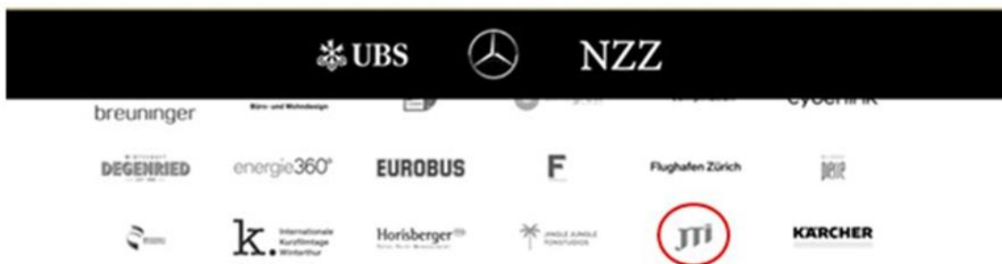
Bild: Screenshots von Unterstützerinnen und Unterstützern von Bund und Kantonen sowie Kooperationspartnern des Zurich Film Festival, darunter JTI.