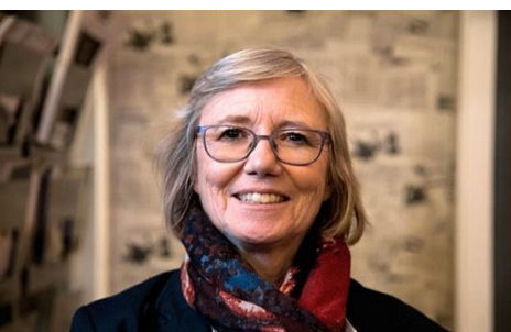
Laurence Fehlmann Rielle Präsidentin AT Schweiz, Mitglied des Nationalrats (SP)