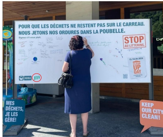
Bild: Eine Passantin, die am nationalen Clean-Up Day im Jahr 2024 einen Kommentar auf den IGSU-Vorstand schreibt, wobei nur das Logo von JTI neben dem eigenen Logo der IGSU (rot eingekreist) zu sehen ist.

Für den Clean-Up-Day im September 2024 führte die IGSU Aufklärungskampagnen mit Plakaten und Strasseninstallationen durch, die die Menschen dazu aufforderten, ihren Abfall ordnungsgemäss zu entsorgen. Passanten waren eingeladen, eine Tafel zu unterschreiben, auf der stand: «Damit der Müll nicht auf dem Boden liegen bleibt, werfen wir unseren Müll in die Tonne.»