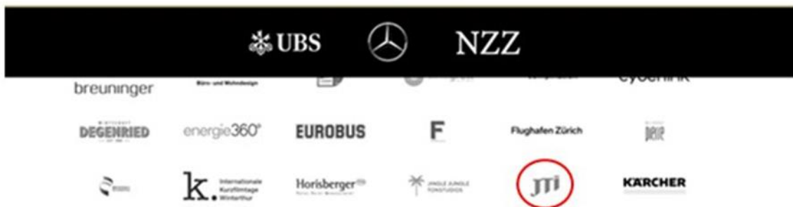
Illustration : captures d'écran des sponsors fédéraux et cantonaux, ainsi que des organisations partenaires du festival du film de Zurich, parmi lesquels JTI.