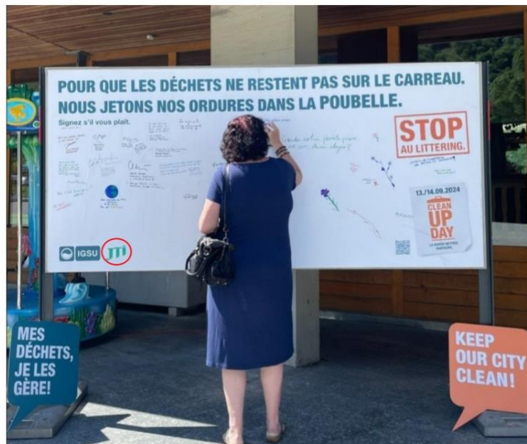
Illustration : lors de la Clean-Up-Day de 2024, une passante écrit un commentaire sur le panneau qui comporte uniquement le logo de JTI à côté de celui de l'IGSU (entouré en rouge).